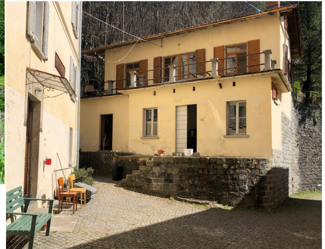
Hof Cima Città