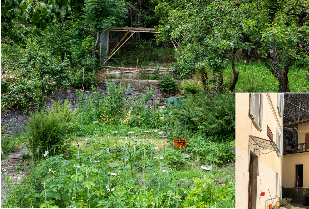
Gemüsegarten mit Feuerstelle