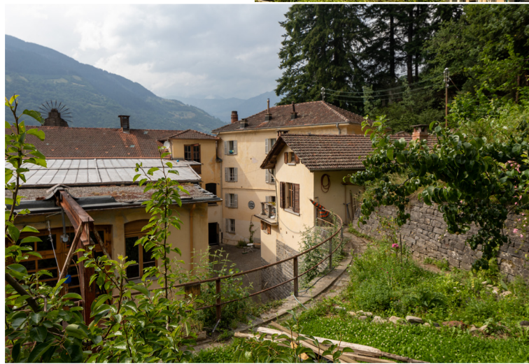
Ansicht von Dangio auf das Fabrikgelände

Cima Città ist umgeben von Bergen, Wald und Flüssen