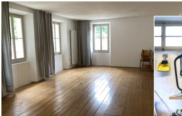
Uno dei tanti spazi di lavoro