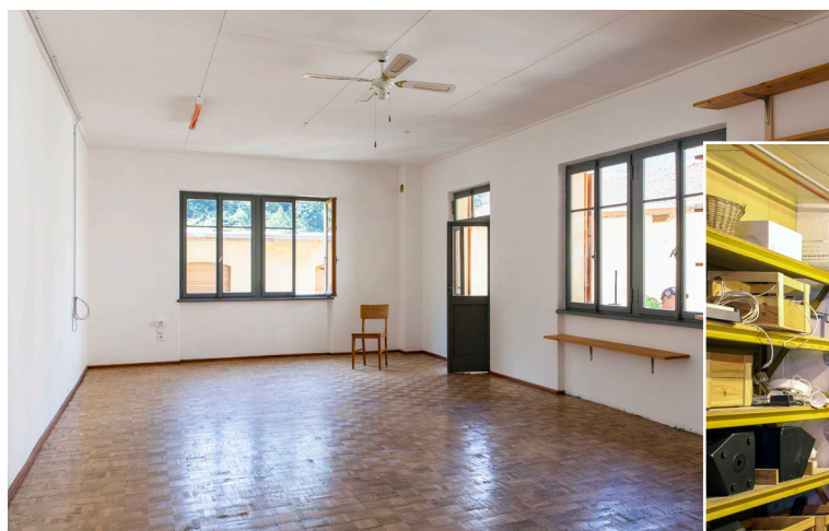
Spazio di lavoro e danza "Giorgio"