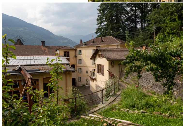
Vista della fabbrica da Dangio

Cima Città è situata tra montagne, foreste e fiumi.