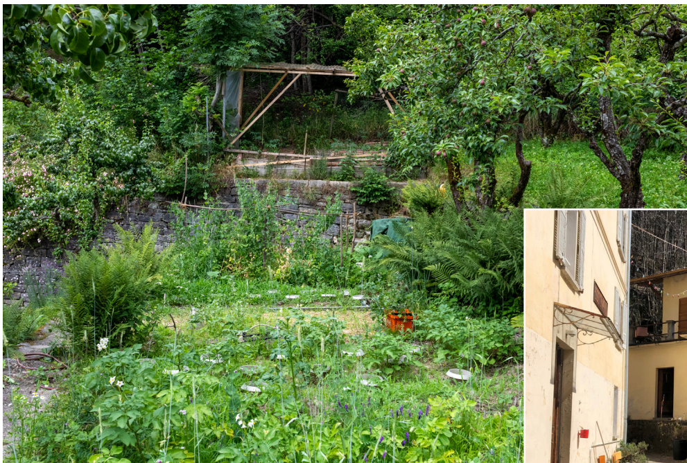
Orto con camino