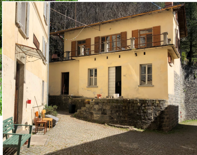
Cortile Cima Città