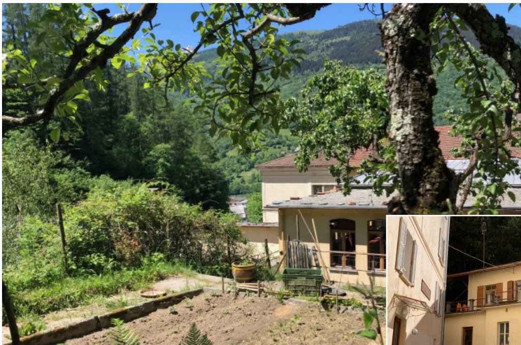
Orto con camino