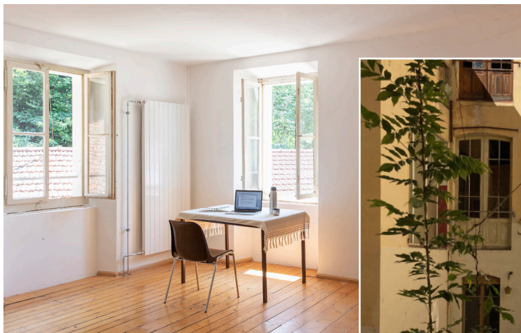
Uno dei molti spazi di lavoro