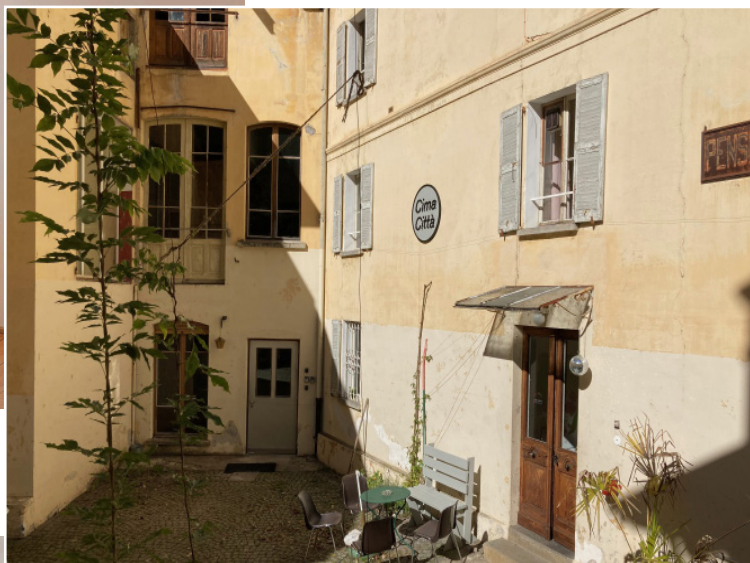
Casa Residenza "Pensionato"