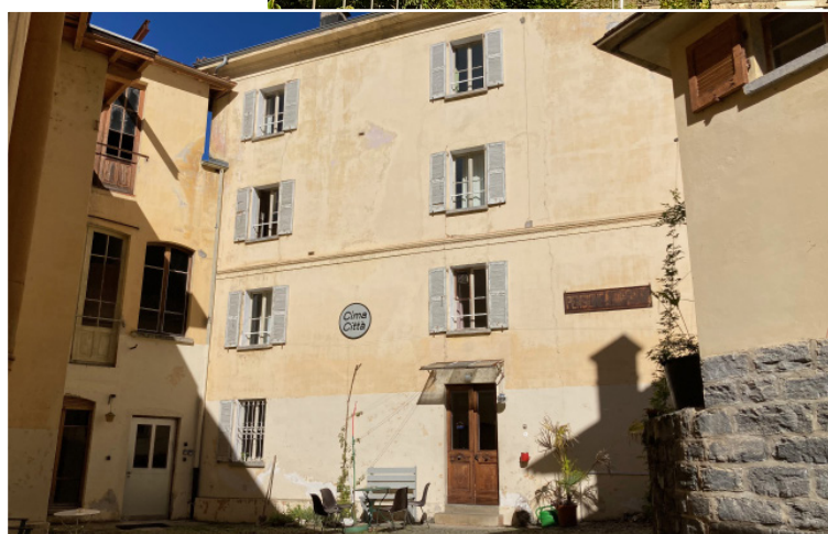
Vista della fabbrica da Dangio