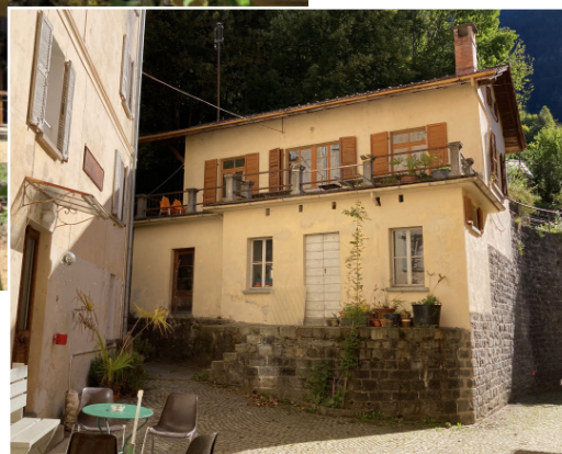
Cortile e casa studio "Giorgio"