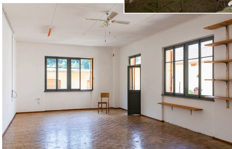
Spazio di lavoro e di danza "Giorgio"